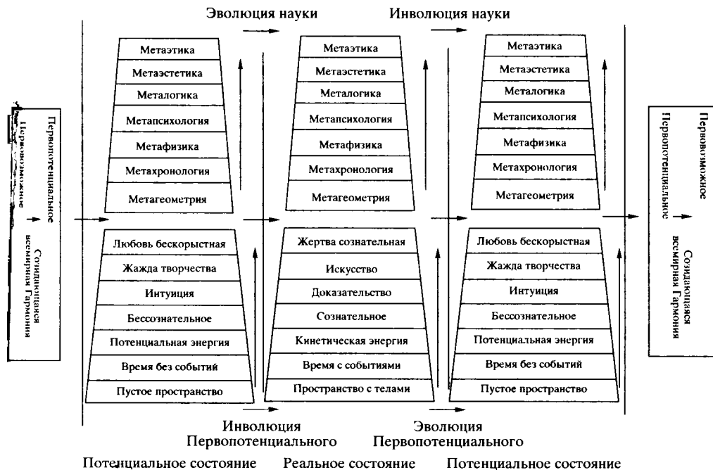
Рис. 1. Возникновение и развитие мира по К.Ф. Жакову

познание и постижение" [14, с. 38]. Потенциальные состояния этих категорий определяются Жаковым как "потенциальные, скрытые свойства общества", а реальные – как "явные свойства общества" [18, с. 82].