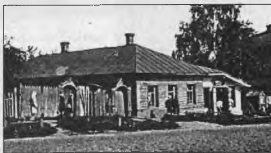
Те самые "Воропашки". Фото начала XX века.