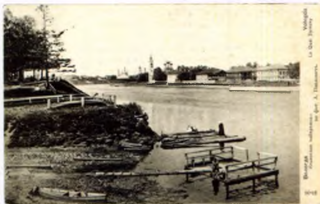
Парадная площадь. Открытка 1904–1908 годов. Вологда: Издательство Е. Тарутиной