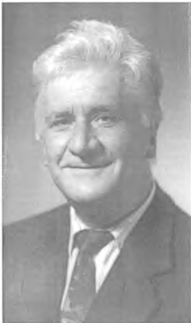
Юрий Клавдиевич Некрасов (1935–2006)