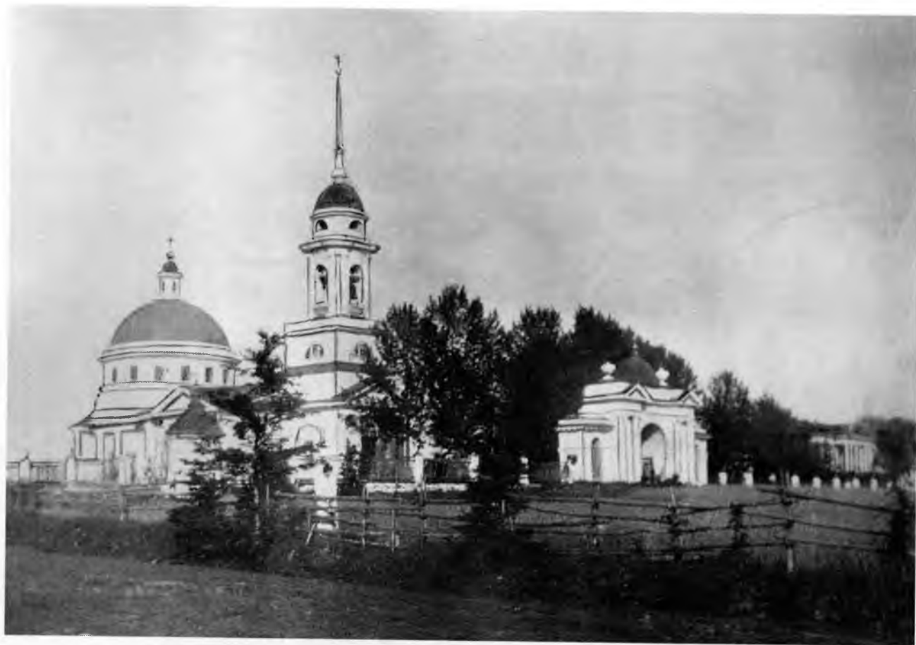
Спасская церковь и ворота в имени Спасское-Куркино. Не сохранились. Фото начала XX в.