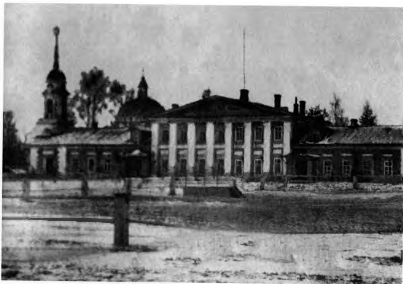
Каменный флигель в усадьбе Спасское-Куркино. Фото начала XX в. Из школьного музея села Куркино

У меня были две сестры, две тетушки и брат 2 . Сестры, по обыкновению, как старшие надомной, драли меня за уши, сердили, выгоняли меня из комнаты, когда я входил к ним. Одна из сестер и из тетушек были моими матушками крестными, и что довольно странно, что как будто от того, что они меня крестили, они и любили меня больше, чем другие 3 .