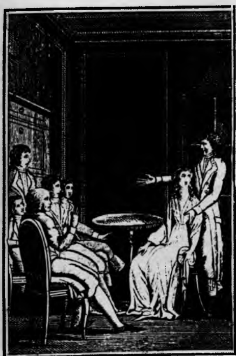
«Я нашла эту почтенную женщину и вы теперь ее видите.»