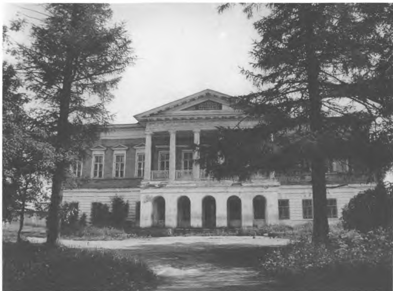
Фасад господского дома Резановых в Спасском- Куркино Вологодской области (современный вид)