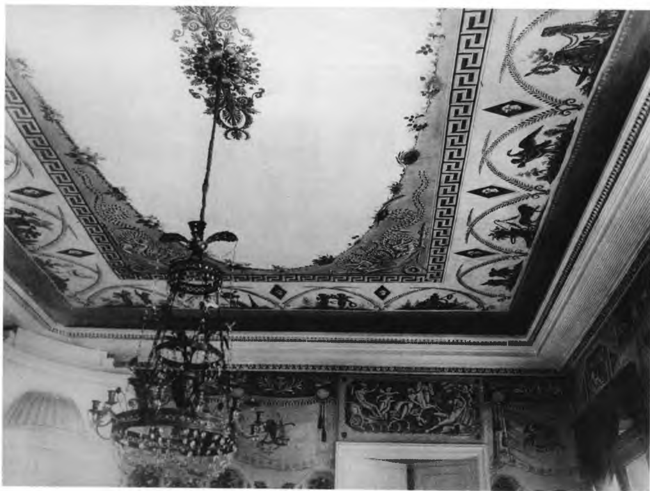
Роспись потолка и стен в гостиной дома Резановых. Фото начала XX в.