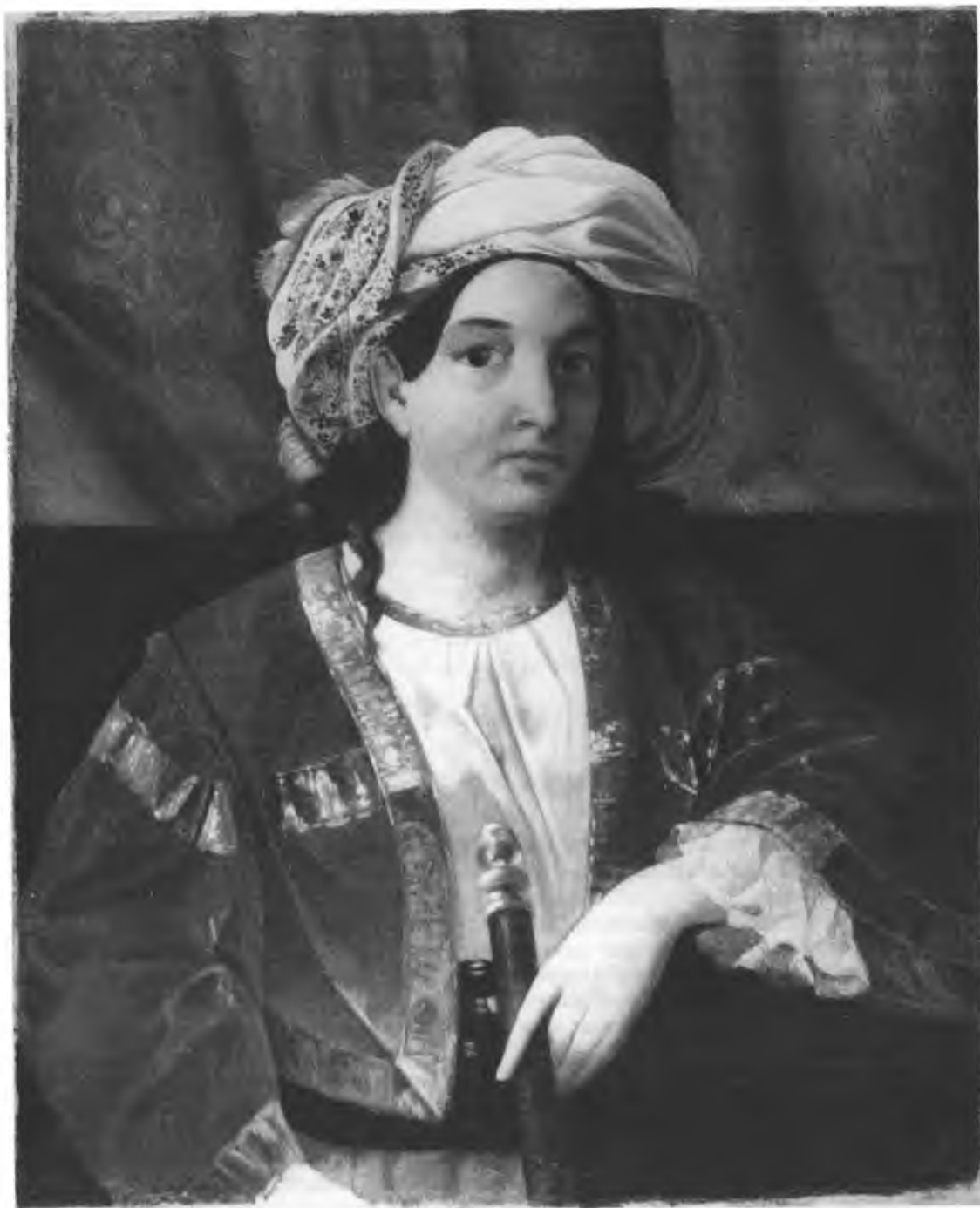
Неизвестный художник. Портрет Алексея Федоровича Резанова. Конец 30-х – начало 40-х годов XIX в. Х., м., 26,6 × 29,9. ВОКМ, инв. № 5138

который был назначен правителем Вологодского наместничества, исполняя эту должность с 1784 по 1792 г. 8 Дальнейшая судьба Ф.Д. Резанова определялась выборными должностями – в 1802 г. он был избран в Совестный суд судьей, в 1808 г. на три года избирается губернским предводителем дворянства и в 1824-м за выслугу лет