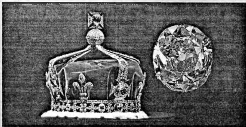
Алмаз Кох-и-Нор и корона, в которой он находится.

По материалам сайта «Энциклопедия камней».