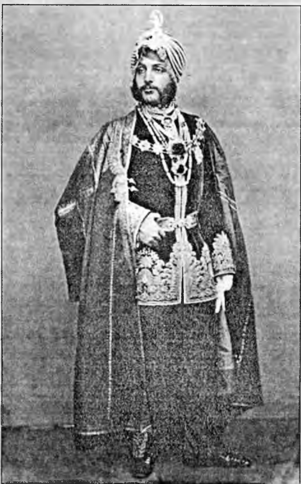
Махараджа Далип Сингх.