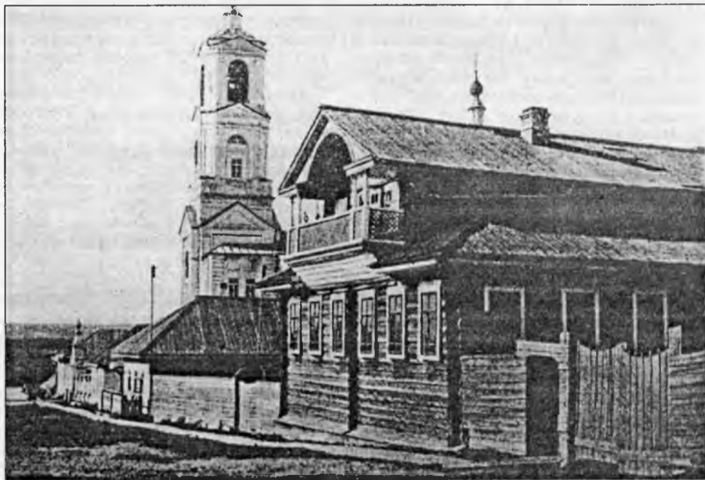
Дом священника В.М. Попова, Ильинский храм и здание церковно-приходской школы, с. Кобыльск, 1910 г.

Проект «Патриотическое воспитание» реализуется при поддержке управления информационной политики Правительства Вологодской области.