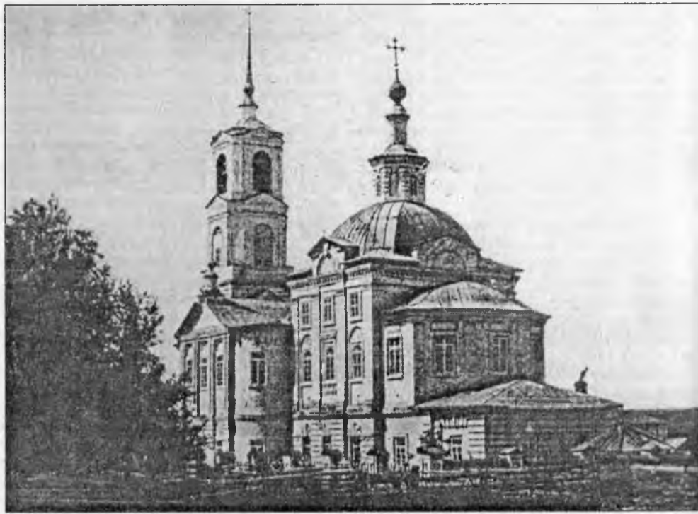
Церковь Ильин Пророка, село Кобыльск, 1910 г.