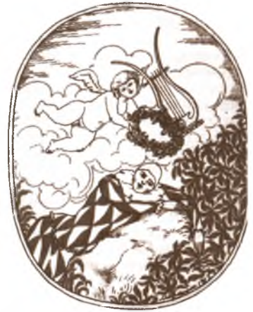
И. Северянин. «За струнной изгородью лиры». Худ. Д. И. Митрохин.