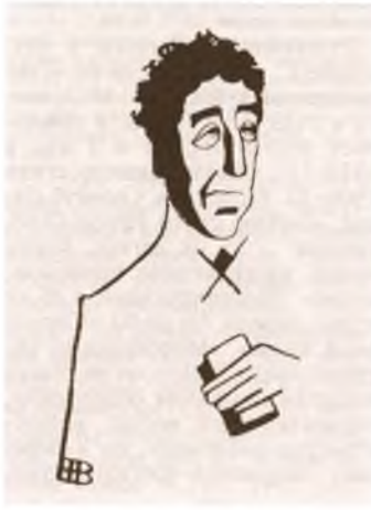
И. Северянин. Шарж худ. Дени. 1914.

В 1912–13 влияние С. распространяется за пределы футуристич. лагеря. Оно ощутимо в сб. В. Я. Брюсова «Стихи Нелли» (М., 1913; реакция самого С. в письме к Л. Д. Рындину от 7 авг. 1913 — см. в его кн.: Царственный паяц..., с. 103) и еще более — в его же неизданной кн.