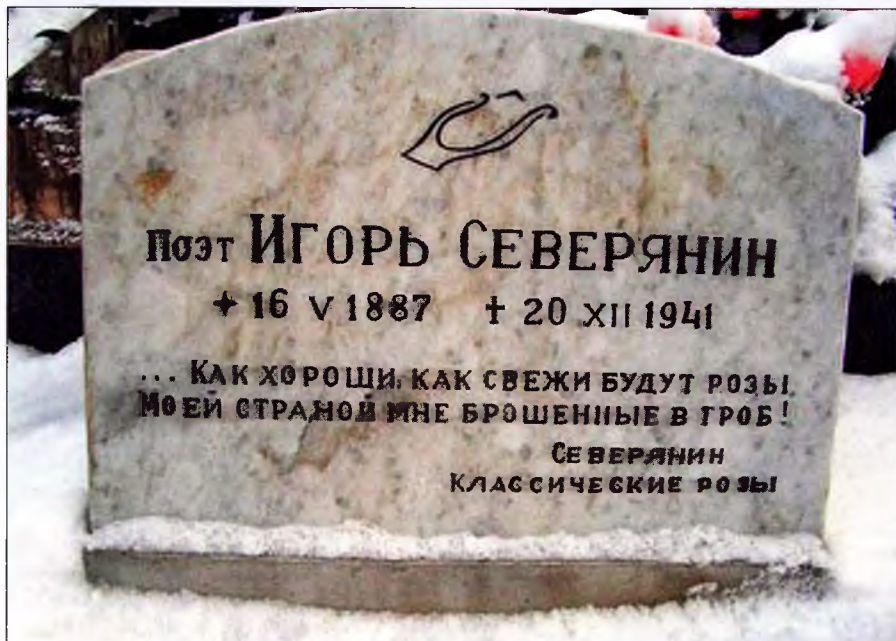
Памятный камень на могиле И. Северянина

В начале 1918 года Игорь Северянин вместе с больной матерью переехал на жительство в эстонский посёлок Тойла. В феврале 1920 года Эстония объявила себя самостоятельной республикой, и поэт оказался за рубежами родины, что стало для него до конца жизни подлинной трагедией.