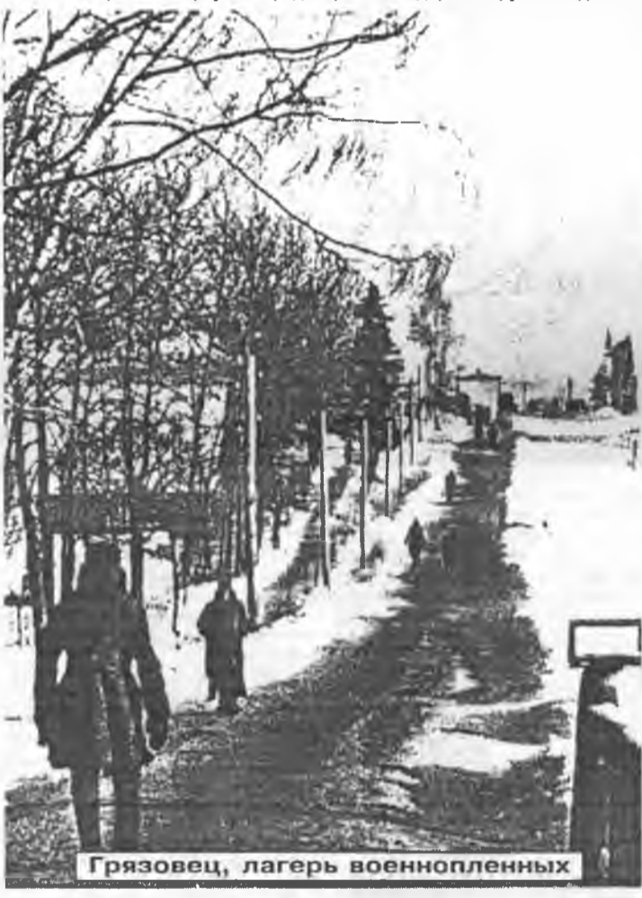
Грязовец, лагерь военнопленных