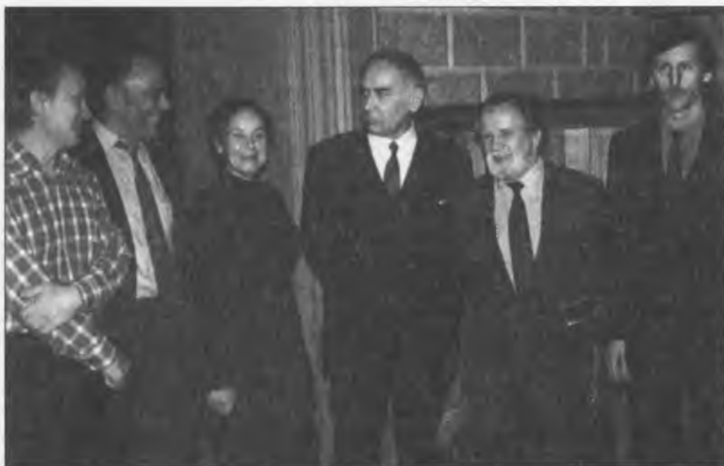
На VIII Съезде писателей России. 1990 г.