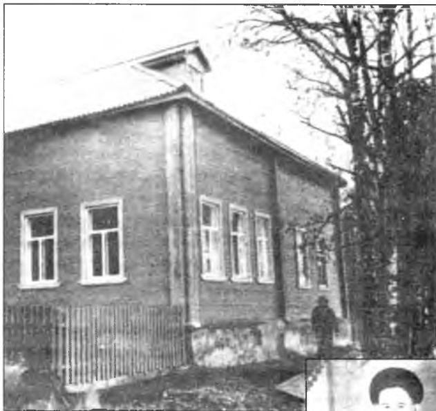
Детдом в селе Никольском

Этим стихотворением Рубцов бесповоротно завоевал доверие читателя. Мы забываем, что это просто «слова»: мы начинаем видеть и зеленый простор, и деревенскую школу, и купол полуразрушенной церквушки, и одновременно мы ощущаем, что пережил поэт.