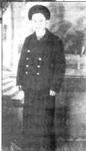
«С мечтой о море»