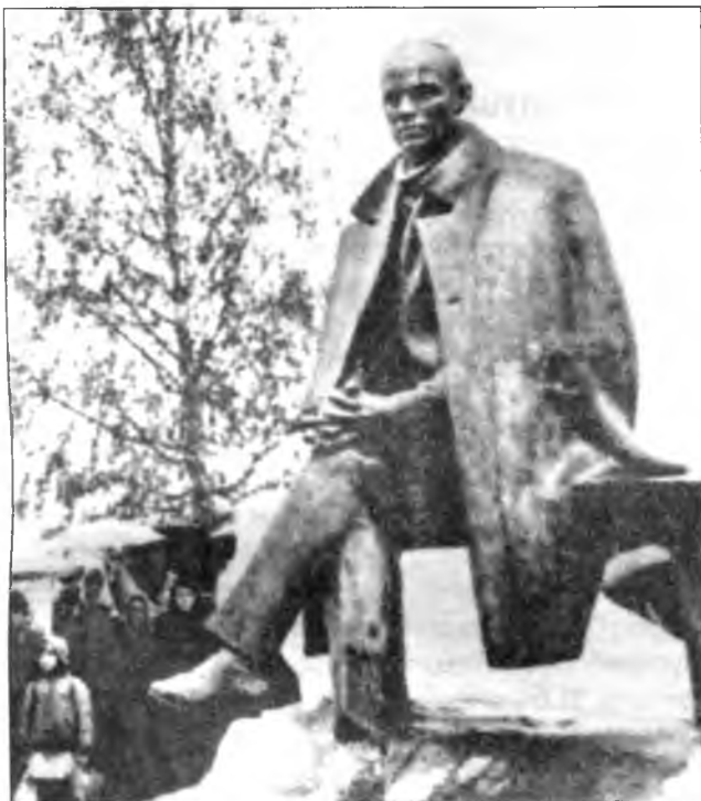
Памятник Рубцову в Тотье

Звучит песня на стихи Н. Рубцова «Букет».