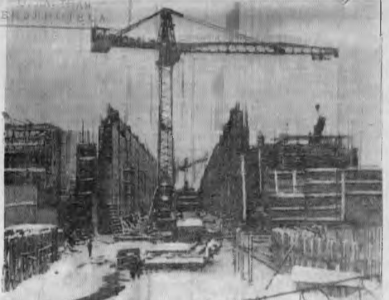
НА СНИМКЕ: строящийся третий шлюз Волго-Балтийского водного пути. Вид со стороны нижней головы.

Партийно-государственный контроль — в действии