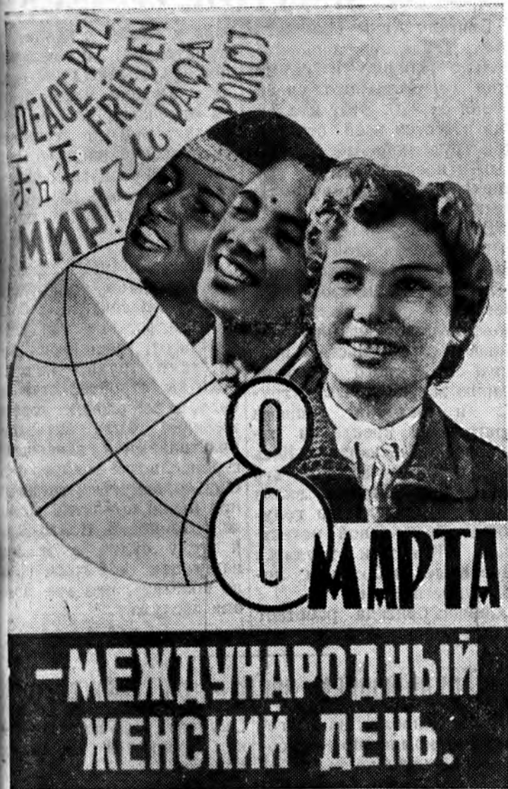
Плакат художника Б. Антонова.