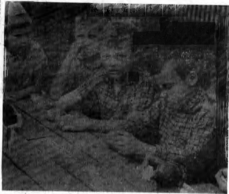
Как уже сообщалось в нашей газете, что в Тудозере расположен пионерский лагерь детей строителей. Первая смена лагеря завершена. 90 человек школьников здесь уже отдохнуло. 16 июля в лагерь приехала вторая смена детей. Собралось опять 90 человек. Дети интересно и увлекательно проводят свой летний отдых в пионерском лагере.

На снимке: пионеры лагеря в часы свободных занятий.