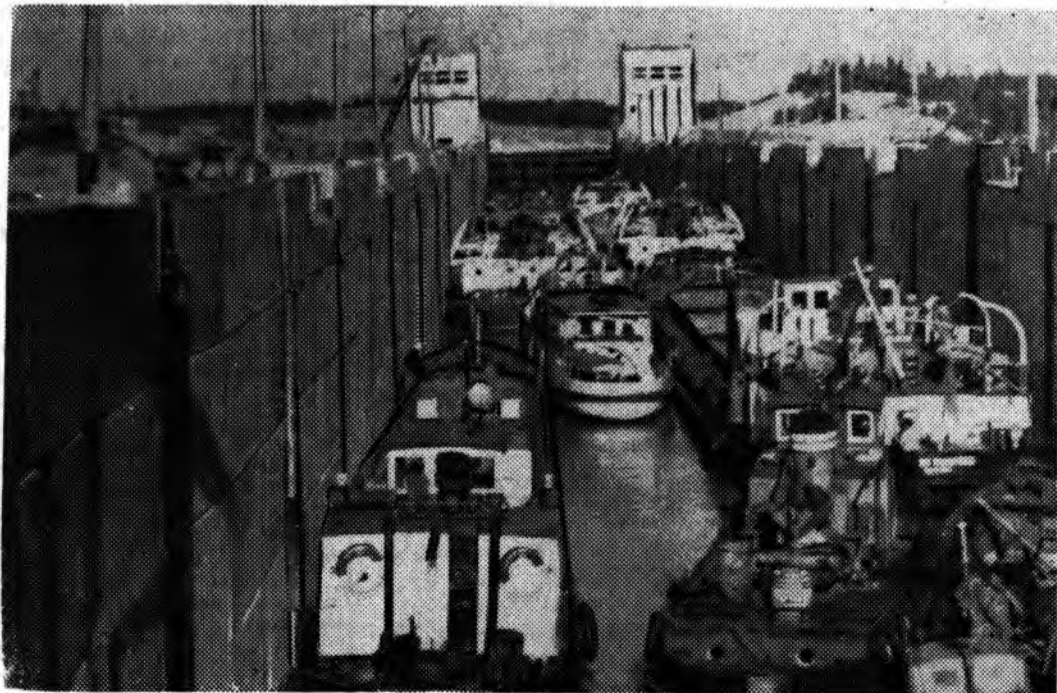
5 ИЮНЯ 1964 года — начало навигации по трассе Волго-Балтийского водного пути. На снимке запечатлен один из моментов шлюзования, несколько различных судов зашли в третий шлюз.