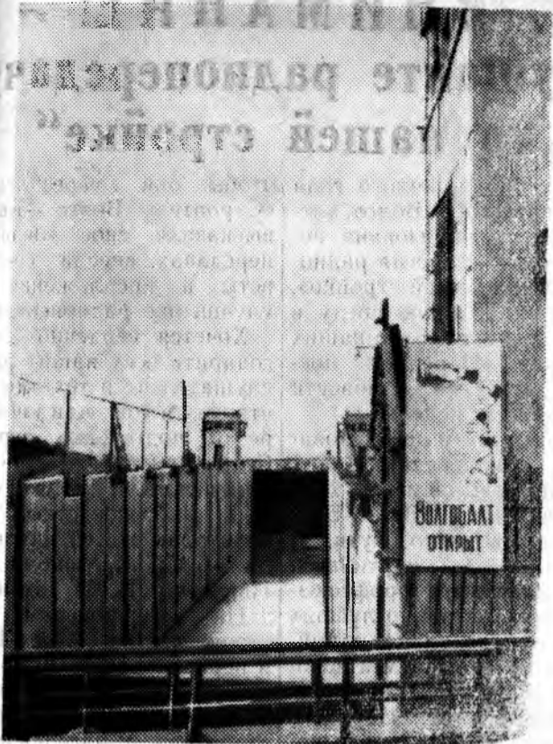
Пятый шлюз за сутки перед открытием навигации.