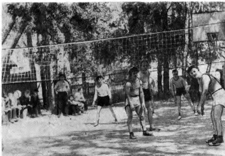
На волейбольной площадке.