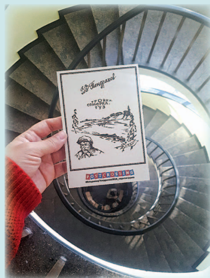
Конкурс хештегов. Калининградская областная научная библиотека (г. Калининград)

Вспомним, как всё начиналось. Весной мы предложили пользователям нашего сайта http://library35.tendryakovka.ru поучаствовать в интернет-викторине, конкурсе творческих работ «На пороге взрослой жизни: тогда и теперь. Моя речь на выпускном» (по мотивам повести В. Тендрякова «Ночь после выпуска»).