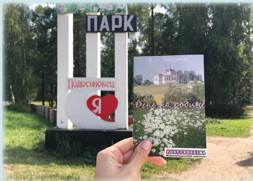
Конкурс хештегов. Подосиновская центральная библиотека им. А.А. Филёва (Кировская обл.)