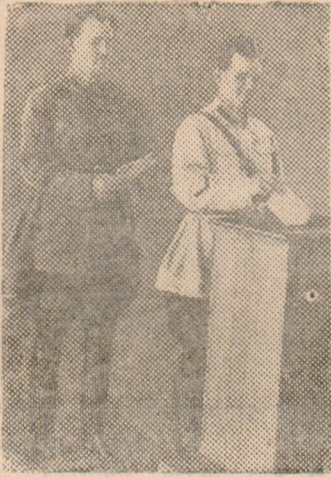
На избирательном участке № 10 Сталинского избирательного округа города Тбилиси, где баллотировалась кандидатура В. М. Молотова.