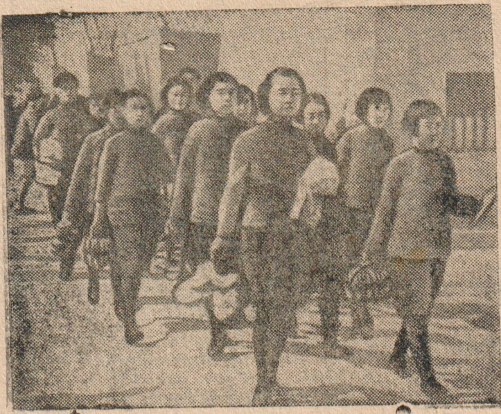
К военным действиям в Китае Молодые девушки несут подарки раненым бойцам китайской армии