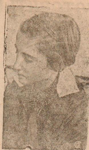
В Москве открыта испанская школа, в которой обучаются находящиеся в настоящее время в СССР дети бойцов республиканской Испании.