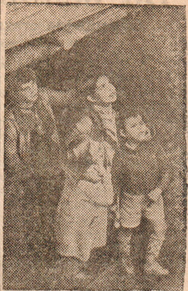
На фронтах в Испании При появлении фашистских самолетов дети ищут убежище (Мадрид)

Пора горсовету взяться за наведение порядка на электростанции. Надо посмотреть, все ли там благополучно... Тотемич.