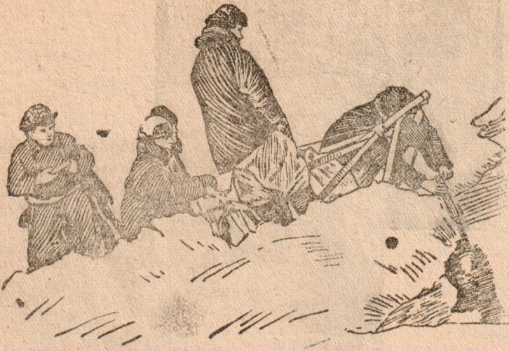
На дрейфующей станции «Северный полюс»