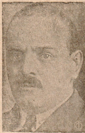
Тов. Н. М. ШВЕРНИК, Председатель Совета Национальностей Верховного Совета СССР

г) членов Президиума Верховного Совета СССР;