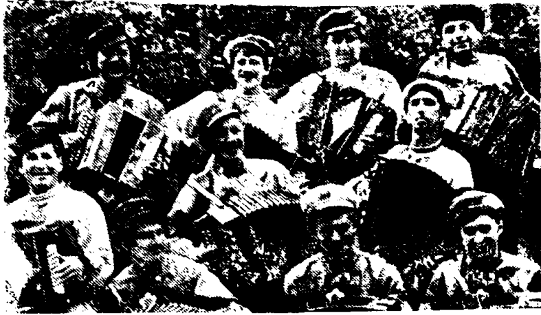
На фольклорном празднике «Играй, гармонь уральская!» в Челябинске выступили самодеятельные гармонисты, балалаечники, частушечники.