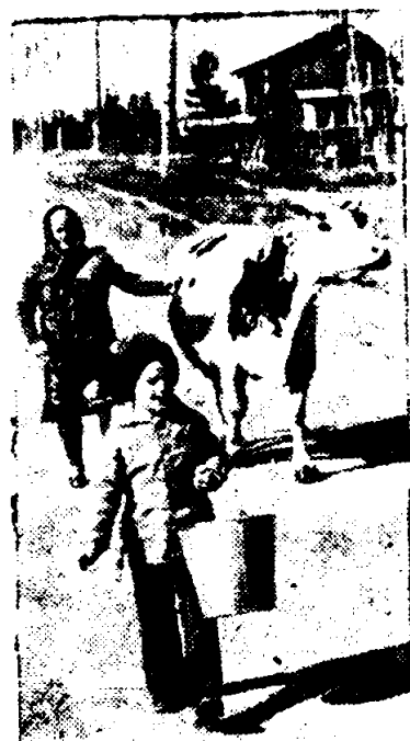
Им стал пригородный совхоз «Бикей», который снабжает жителей быстро развивающегося

города молоком, мясом, овощами. По 4 тысячи килограммов молока получают здесь ежегодно от каждой коровы. Неплохо обстоят дела и на свинопольном комплексе, где содержат 5 тысяч голов свиней. Всех животных в «Бикее» выращивают на собственных кормах. Хозяйство на иркутской земле продолжает расти. У тайги отвоеваны большие площади под пашни, производственной базу, поселок. Все здесь строится добротной, с размахом под стать сибирским масштабам. В этом году еще сорок семей работников совхоза получат новые квартиры.