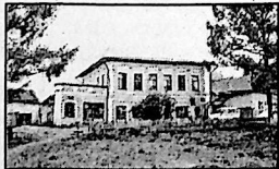
СВИДЕТЕЛЬСТВО РЕГИОН. ИНСПЕКЦИИ (Г. ТВЕРЬ) № Т-0571

РЕДАКТОР В. К. ДУРОВ. Учредители: исполком муниципального Собрания Тотемского района и управление печати и телерадиовещания администрации Вологодской области.