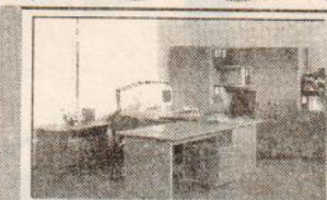
СТУЛЬЯ КРЕСЛА любой цветовой гаммы ул. М. Ульяновой, 37. (8172) 72-20-53 МЕБЕЛЬ для ОФИСА ответственных производителей