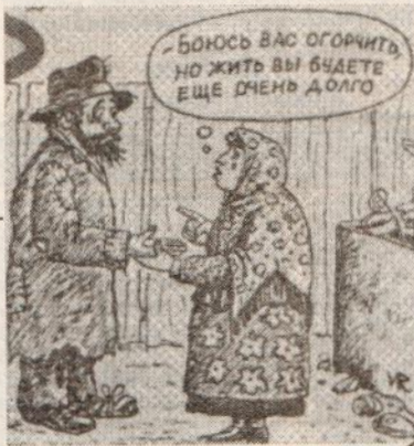
«Бойсь вас огорчить, но жить вы будете еще очень долго»