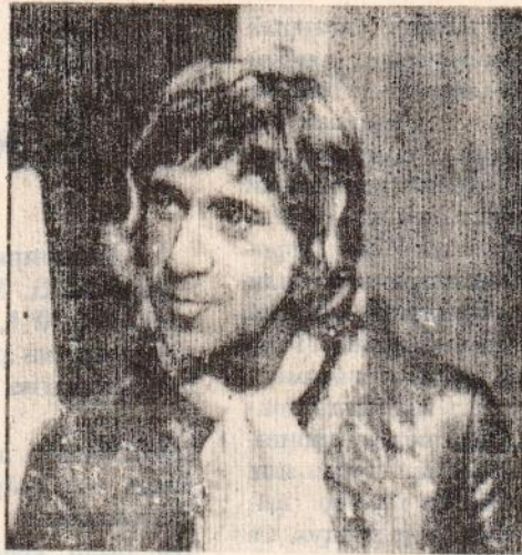
Кадр из фильма «Сказ про то, как царь Петр арапа женил».

Товарищи ученые, доценты с кандидатами! Замучились вы с пилсами, запутались в нулях, Сидите, разлагаете молекулы на атомы, Забыв, что разлагается картофель на полях. Из гибли да из плесени бальзам извлечь пытаетесь И корни извлекаете по десять раз на дню, — Ох, вы там добалуетесь, ох, вы доизвлекаетесь, Пока сгниет, заплесневет картофель на борню! Автобусом до Сходни доездаем, А там — рысцой, и не стонать! Небожь картошку все мы уважаем, — Когда с сольюцой ее память, Вы можете прославиться почти на всю Европу, коль С лопатами проявите здесь свой патриотизм, — А то вы всем кагалом там набросились чгохлю во Собаки пожами режете, а это — бандитизм! Товарищи ученые, кончайте поножовщину, Бросайте ваши опыты, гидрит и ангидрид: Садитесь в полторки, взайдите к нам в Тамбовщину, — А гамма-излучение денек повременит, Полторкой к Тамбову подъезжаем, А там — рысцой, и не стонать! Небожь, картошку все мы уважаем, — Когда с сольюцой ее память, К нам можно даже с семьями, с друзьями и знакомыми — Мы славно тут разместимся, и скажете потом,