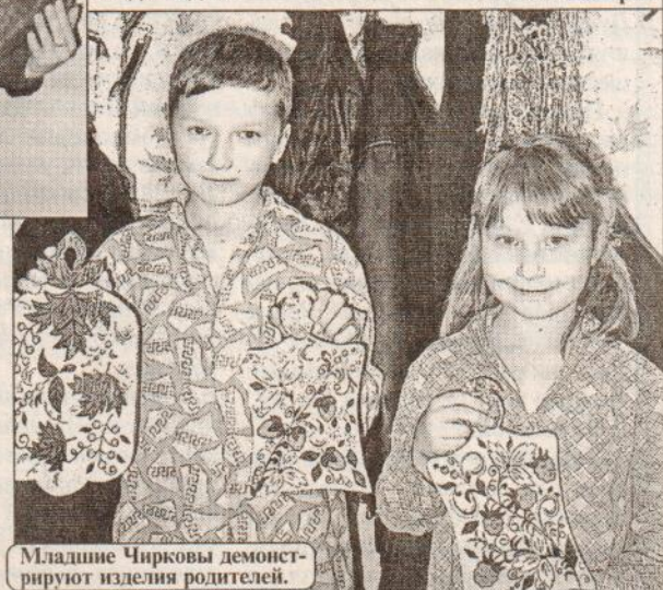
Младшие Чирковы демонстрируют изделия родителей.