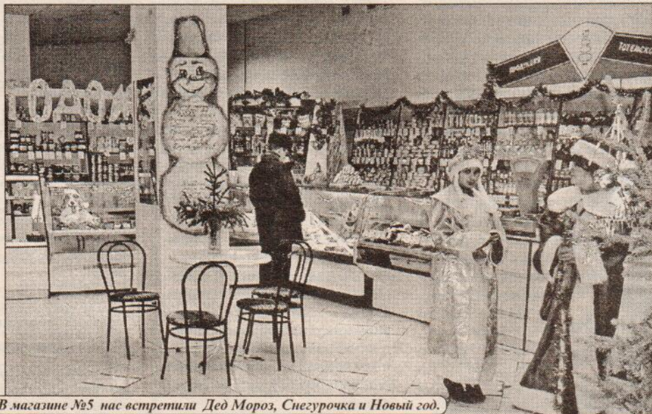
В магазине №5 нас встретили Дед Мороз, Снегурочка и Новый год.

было присуждено коллективу магазина № 5, активно использовавшему в оформлении символику наступающего года Собаки. Причем все элементы украшения сделаны собственными руками торговых работников. Прилавки, витрины, ценники разрисованы в едином стиле. А хлебосольная «потребительская» корзина, испеченная на собственном производстве райпо, внушает покупателям надежду на сытую и спокойную жизнь в предстоящем году, дескать, Собака корм всегда себе добудет. Ощущение праздника появляется еще у входа в магазин – там, на улице, установлена лесная красавица. Дипломом второй степени награжден коллектив магазина «Фаворит», дипломом третьей степени – торговый комплекс «Варницы».