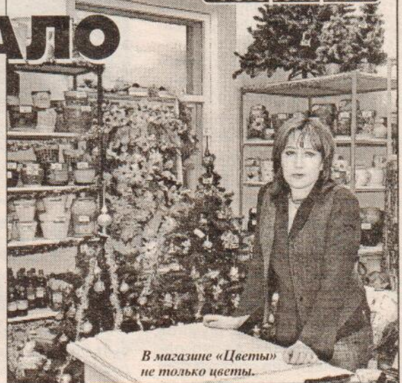
В магазине «Цветы» не только цветы.