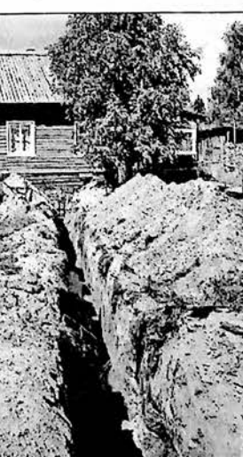
Газифицирован д. Маны-

и Углицкая. Работы по прокладке газопровода начнутся уже в августе. В планах завершение газификации по высокому берегу Ковды и за рекой. Подключение газа потребителям начнется в процессе рассмотрения заявок по завершении строительства. Подключать газ потребителям будет наш «Тотемрайгаз», эксплуатировать газопровод - тоже. Эта организация занималась летом строительством и подключением газа на ул. Заводская в п. Глубокое за счет средств муниципального бюджета. Подведен газ к пяти домам, сколько квартир будет подключено, зависит от того, сколько будет заявок. Перспективы развития газификации района на будущий год обширны. Так, в этом году не удалось претворить в жизнь проект газификации дома № 10 по ул. Белоусовская в Тотьме. Средства будут закладываться в бюджет 2007 года. Продолжатся работы по строительству газопровода за счет областных средств в Галицкой, Брагинской и Углицкой деревнях. В перспективе продолжение газификации д. Задняя и д. Черняково. Реанимируются проекты по газификации сельских поселений. В этом году силами «Газпрома» газифицирован д. Маны-