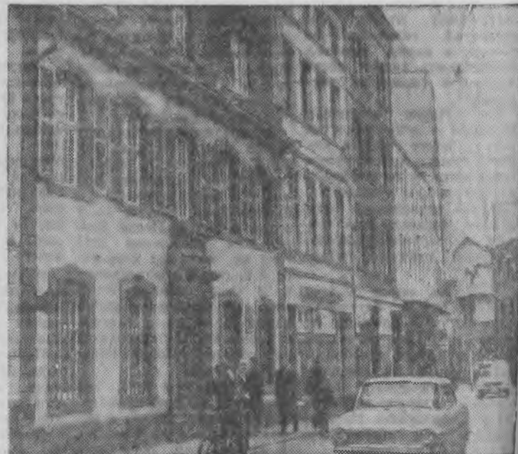
Дом номер 10 (крайний слева) по улице Брюккенштрассе в стаинном немецком городе Трире, где 5 мая 1818 года родился Карл Маркс.